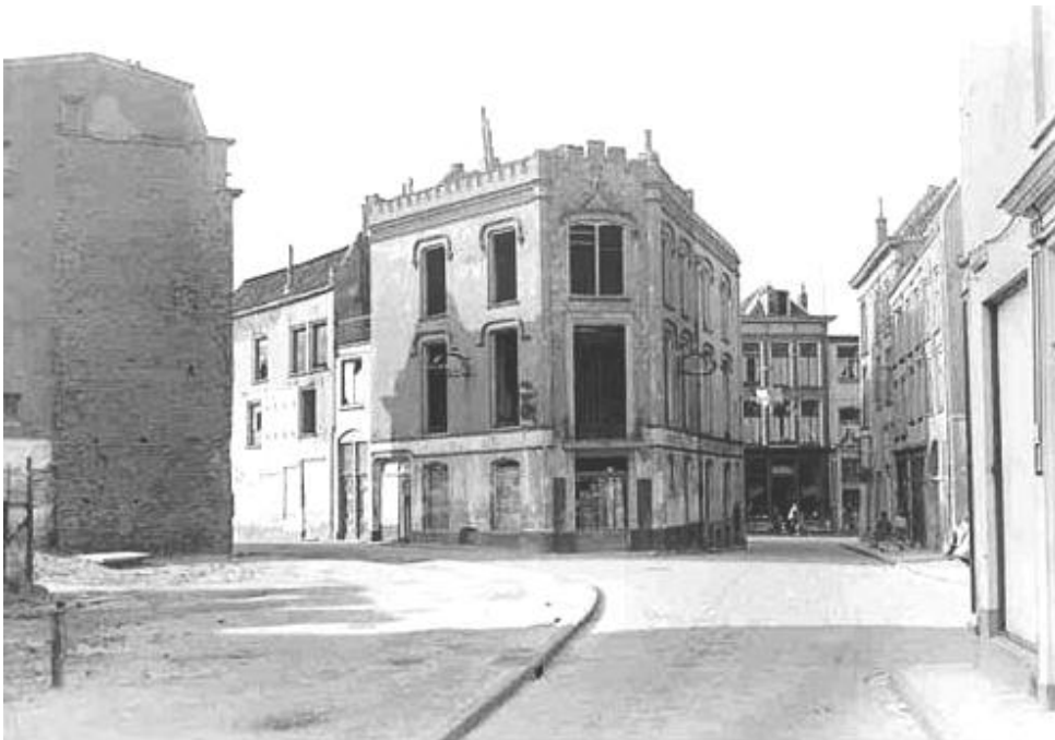
Heuveltje 2, in de rechterstraat aan de linkerkant. Op de achtergrond de Lange Hezelstraat. Waar deze panden stonden tot 1953 is nu het pleintje.

* Dit verhaal kunt u ook lezen op de website https://oorloginnijmegen.nl/ . Op deze website onderzoeken Leo van den Munkhof en Willem Oosterbaan de oorlog die in de jaren 40 woedde in Nijmeegse straten en huizen door belangrijke primaire bronnen voor een groter publiek te ontsluiten en te interpreteren. Alle bronnen zijn terug te vinden via de genoemde namen in de 'Namenlijst 1939-1945' onder de ingang WIE op deze website.